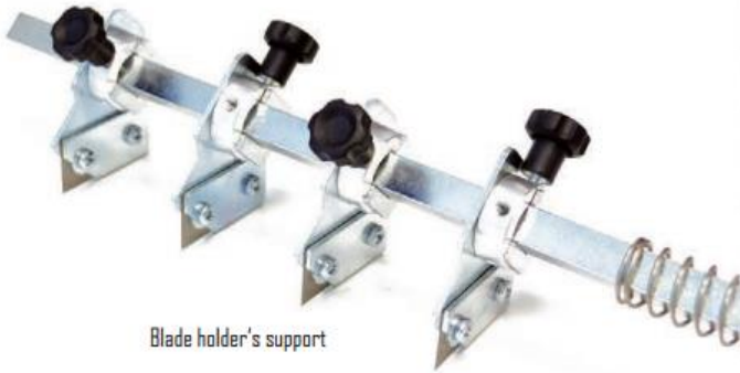
Blade holder's support

Der Rollenschneider ist mit zwei 3" Kernhalter ausgestattet und kann Rollen mit einem Durchmesser von 250 mm aufnehmen. Die maximale Breite der Rolle darf 220 mm betragen. Die schmalste schneidbare Rollenbreite sind 22mm